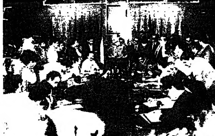
مؤتمراً صحافياً الدكتور جعجع خلال

أعلن الدكتور سمير جعجع رئيس هيئة الأركان في القوات اللبنانية، وقف إطلاق نار من جانب واحد في منطقة صيدا اعتباراً من الساعة الرابعة بعد الظهر، مهدداً لسحب مقاتلي القوات من غير أبناء المنطقة ابتداء من صباح اليوم. وحمل رئيس الجمهورية ورئيس الحكومة على رغم استقالته، والحكومة مجتمعاً وقيادة الجيش، مسؤولية أي عمل مثل ما كان مباحاً كان جمعه أو نوعه بعد تنفيذ هذه الخطوة.